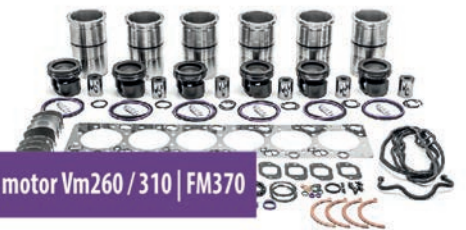
Kit motor Vm260 / 310 | FM370

Fotos no contractuales. Promociones vigentes hasta el 30/09/19 Volvo Trucks & Buses Argentina S.A. determinará las listas de precios y los plazos en que las mismas estarán vigentes, pudiendo modificarlas sin previo aviso.