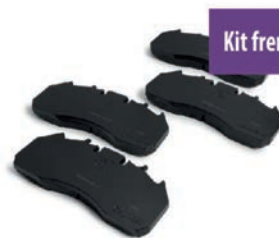
Kit frenos Fm11 | FH 13