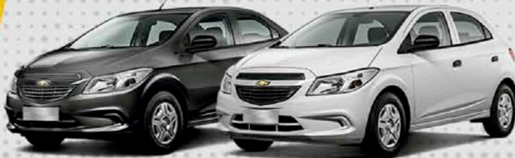
• PRISMA JOY