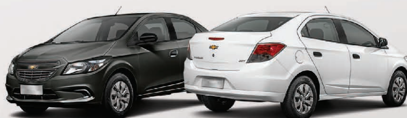
Chevrolet Onix Joy

TENÉ HOY TU OKM LIBRE DE INFLACIÓN 2019 Y $0 DE AUMENTO.